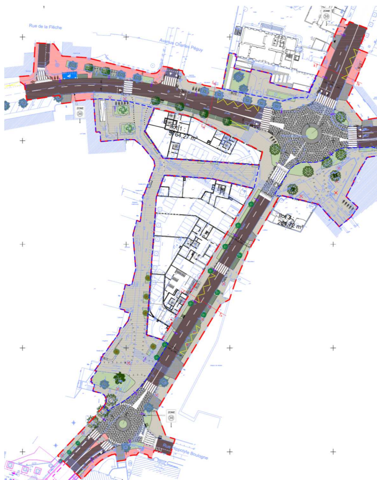
Schéma de principe du projet d'aménagement

La présente convention a pour objet de définir les modalités de constitution, d'organisation et de fonctionnement du groupement de commandes entre le Département des Hauts-de-Seine et la ville de Sceaux, pour la passation de marchés ou accords-cadres communs (maîtrise d'œuvre, prestations intellectuelles, travaux, ...) pour la réalisation de l'opération d'aménagement des espaces publics communaux et départementaux autour de la place du Général de Gaulle à Sceaux (notamment le carrefour des routes départementales n°60 et n°67), telle que figurant à titre informatif dans l'extrait de plan ci-dessous.